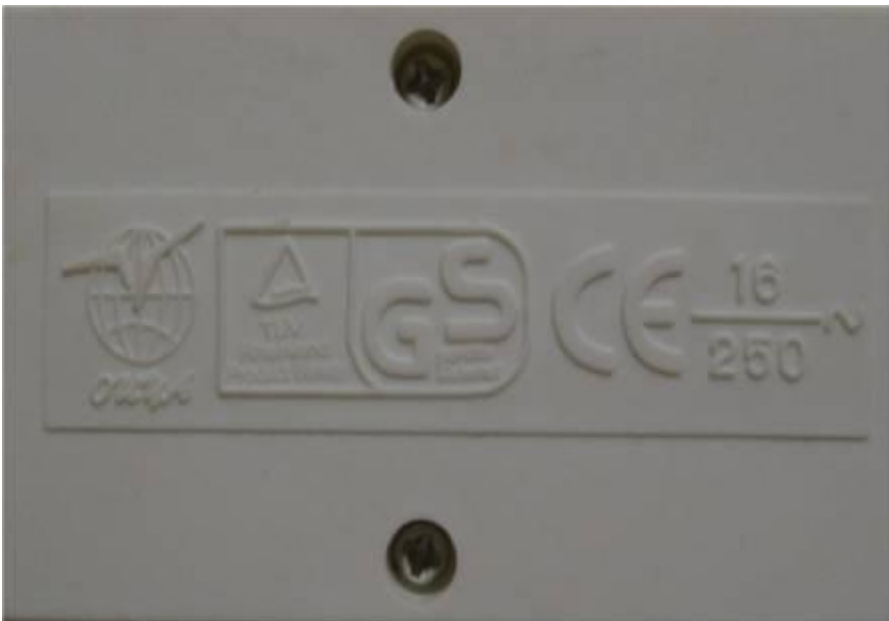
Abb. 2: Kennzeichnungen auf einer Steckdosenleiste