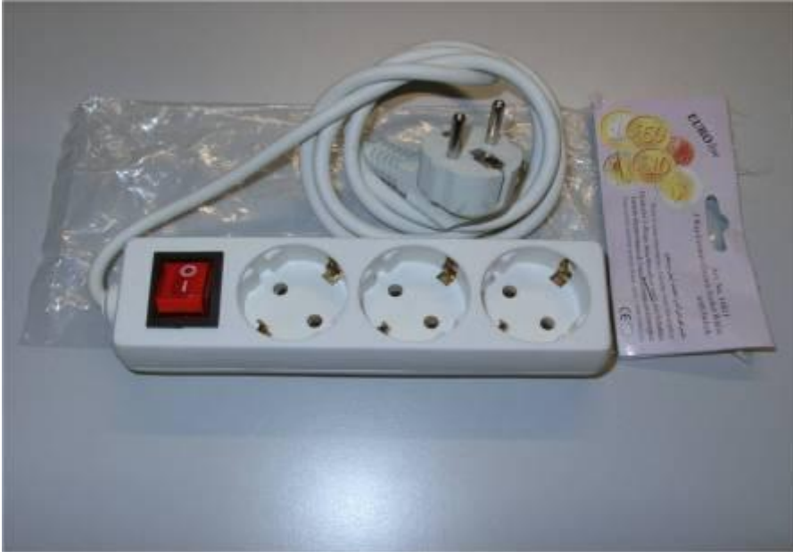
Abb. 1: Handelsübliche Steckdosenleiste