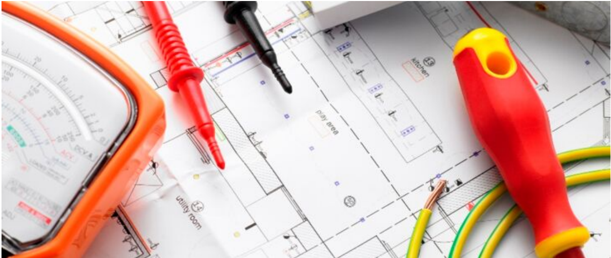
Messung von Ableitstrom sicher durchführen