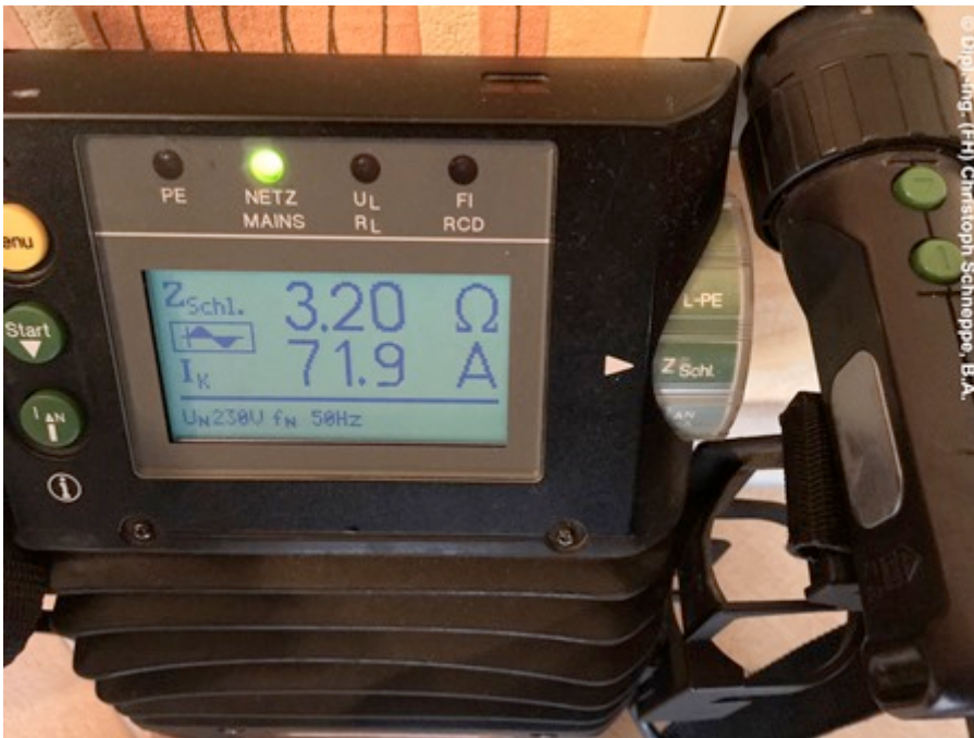
Unzureichender Schleifenimpedanz-Messwert an einem Steckdosenstromkreis