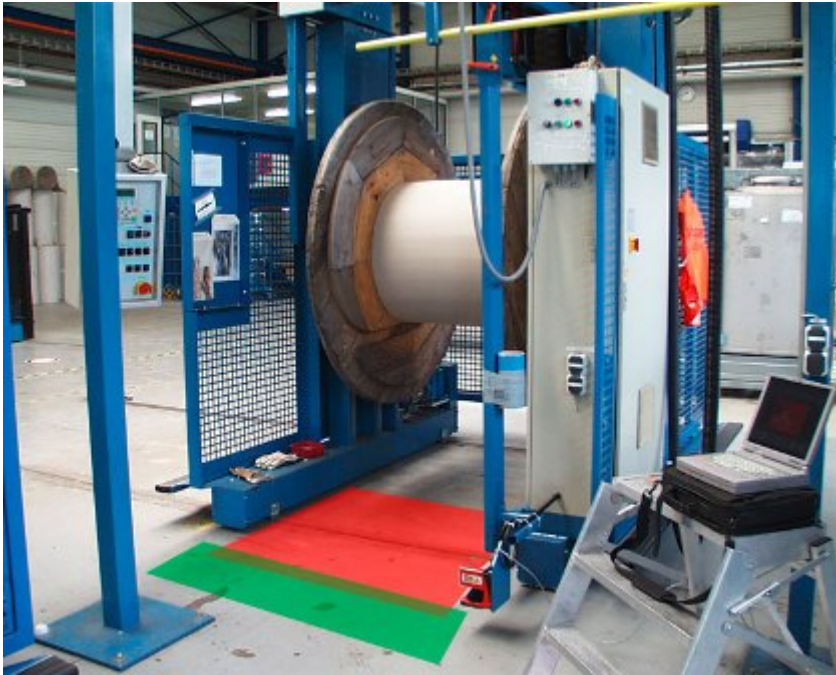
Darstellung der Erkennungsbereiche

Befinden sich zwei Personen im Erkennungsbereich 1, muss die Anlage im Fehlerfall durch den Not-Aus-Taster abgeschaltet werden. Befinden sich zwei Personen im Erkennungsbereich 1 und verlässt eine diesen durch die Schleuse, wird die im Erkennungsbereich 1 verbleibende Person überwacht. Darin liegt der große Vorteil dieser Anwendung.