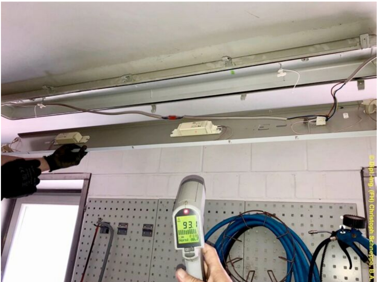
Bei Oberflächentemperaturen von über 90 °C sind Schädigungen der Leitungsisolierungen der Durchverdrahtung nicht auszuschließen.

Die für die Durchgangsverdrahtung verwendeten Kabel und Leitungen müssen in Übereinstimmung mit den Temperaturangaben auf der Leuchte oder der Montage-/Installationsanweisung des Herstellers ausgewählt und installiert werden. Im Absatz 559.5.6 der DIN VDE 0100-559 heißt es dazu, dass externe Kabel, Leitungen und deren Adern, die durch die Leuchte hindurchgeführt werden müssen, so auszuwählen und zu verlegen sind, dass diese keiner Schädigung oder keinen Beeinträchtigungen durch Hitze oder UV-Strahlung ausgesetzt sind. In diesem Zusammenhang können Schutzmaßnahmen durch wärmebeständige Leitungen bzw. Adern oder Abschirmmaßnahmen zum Einsatz kommen (vgl. DIN VDE 0100-559 ).