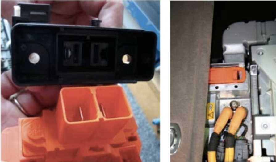
Spezielle Servicestecker für eine sichere Freischaltung